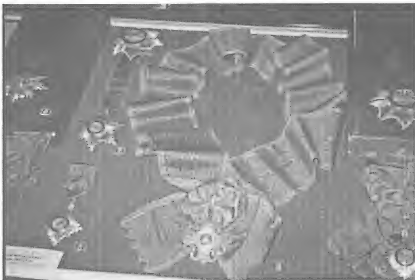
Выставка орденов, полученных королями Нидерландов от шахов Ирана времен Каджаров

Как и на первом съезде, параллельно была проведена Конференция, посвященная на этот раз одежде эпохи Каджаров. По словам Р.А. Садыхова, на встрече представителям рода был предложен богатый выбор литературы, посвященной научному изучению Каджаров, что свидетельствует о высокой оценке прогрессивной мировой общественностью культурного наследия периода царствования Каджаров. Также, представители рода в ходе съезда посетили Амстердам, где побывали в королевском замке-дворце, особое место в котором занимает экспози-